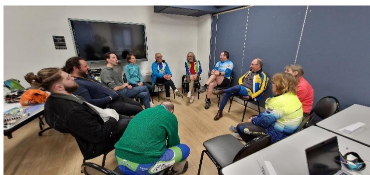
Photos prises les 18 et 19 mars dernier, au CFDAS d'Eaubonne, lors de la formation « Animateur Club » organisé par le bureau du CODEP 95

Prochaine étape : le PSC1 de secourisme !