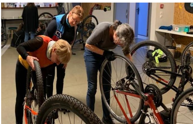
Photo prise par Céline le 4 mars 2023 à l'Espace Jeunesse et Famille, à Eaubonne.