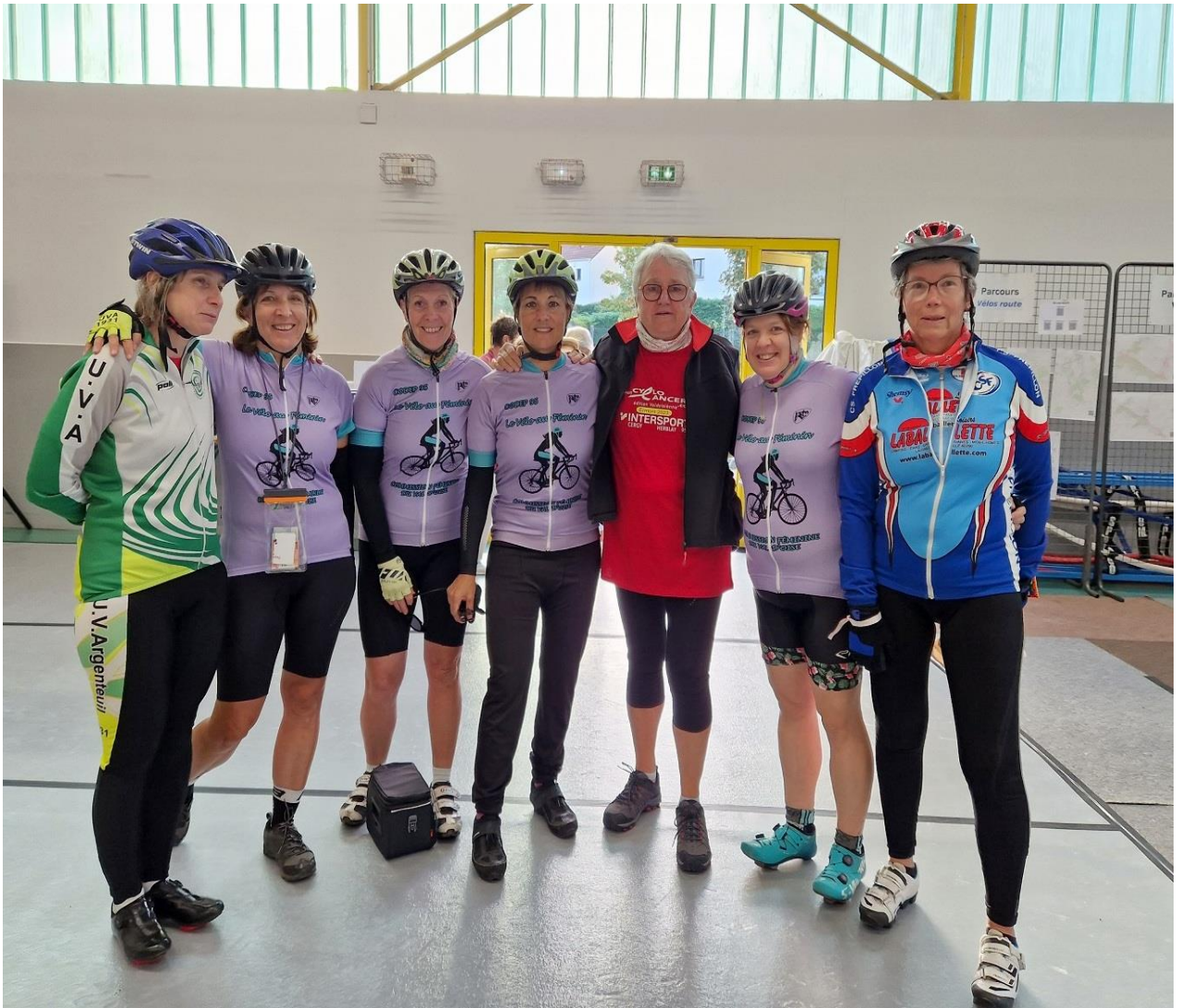
Cyclo-cancer, le 8 Octobre 2023 devant le gymnase Gaston Rebuffat.