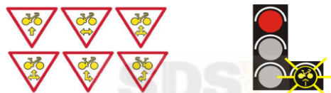
Exemples de panneaux M12 autorisant les cyclistes à franchir l'intersection dans le ou les sens indiqués par la flèche.