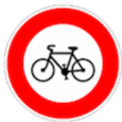
Panneau d'interdiction B9b - Circulation des cyclistes interdite