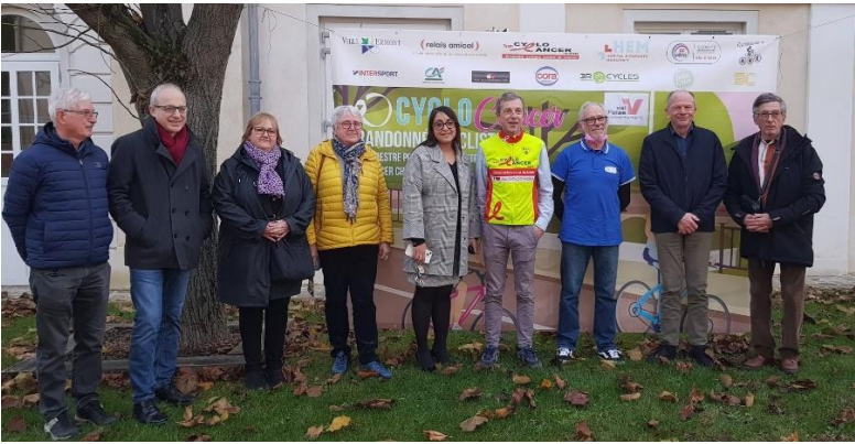
Les organisateurs de la Cyclo Cancer.

Cette mobilisation pour les enfants malades du cancer a pu s'opérer grâce à la fédération du Relais Amical du Val d'Oise, de l'Amicale des Randonneurs Ermontois, du Cyclo-Club de Beauchamp, du CoDep95 et du Team Cyclocancer avec le soutien de la municipalité d'Ermont.