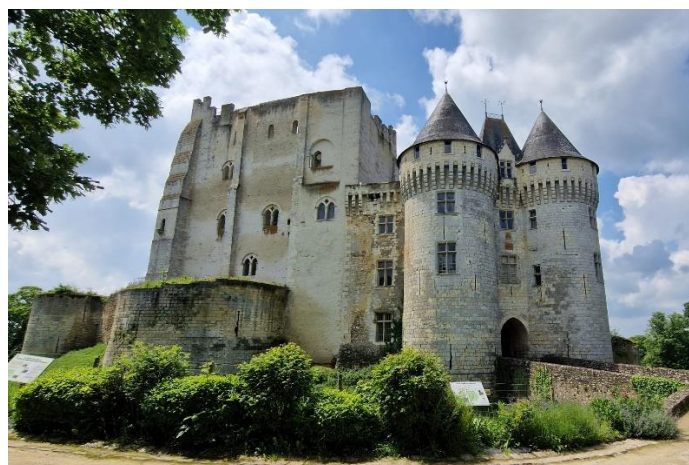
Château des Comtes du Perche, Nogent-Le-Rotrou. 22 Mai 2024