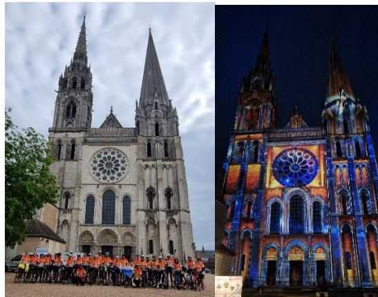
La Cathédrale de Chartres de jour, et de nuit. 23 et 24 Mai 2024

Sur ces rires, une partie du groupe, pas encore fatiguée, décide d'aller voir les illuminations nocturnes de la Cathédrale. Un moment féérique pour clôturer cette dernière soirée.