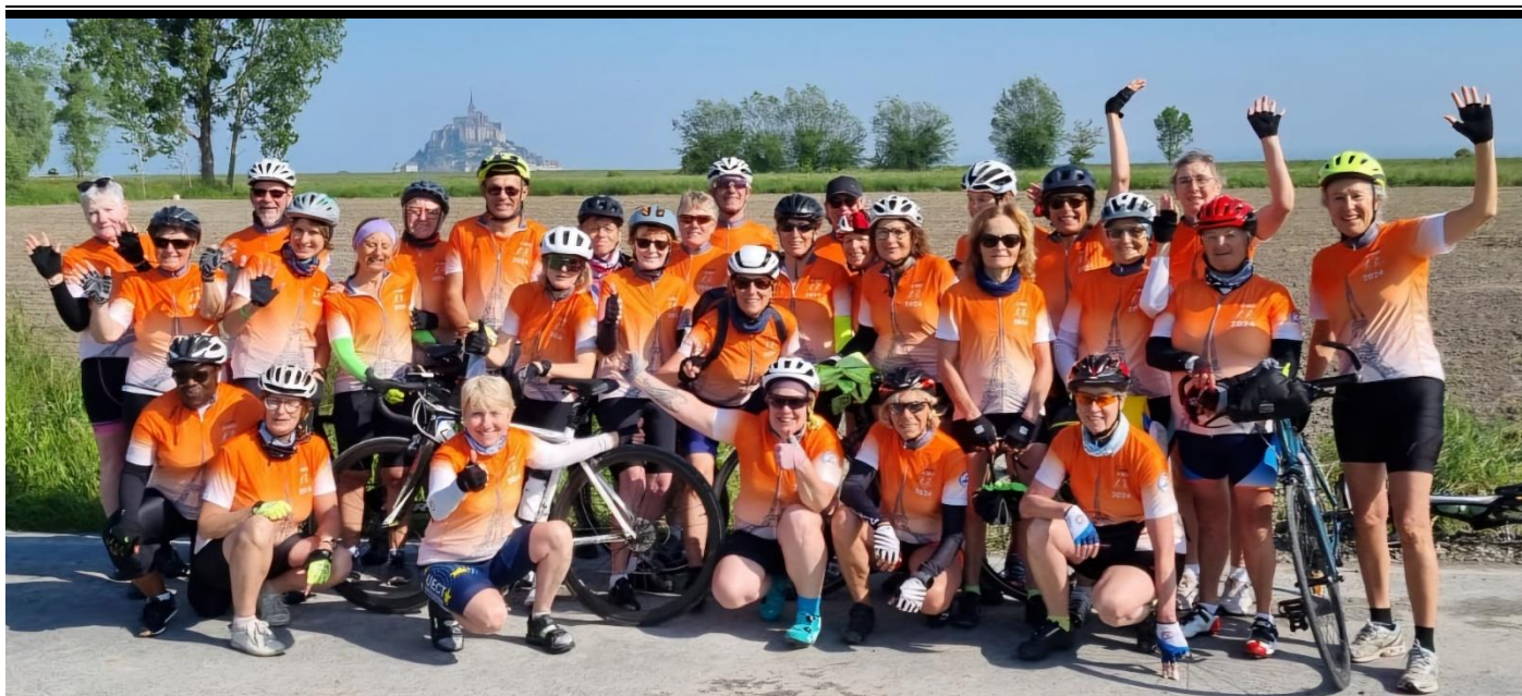
Dernière photo de Groupe en quittant le Mont Saint-Michel. 20 Mai 2024