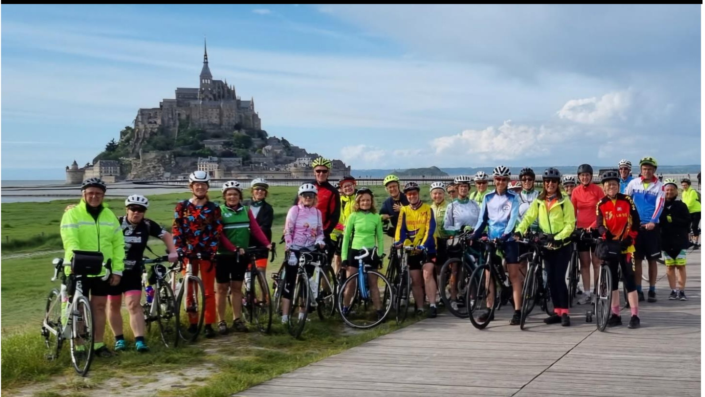
Toute l'équipe devant le Mont Saint-Michel, 19 mars 2024