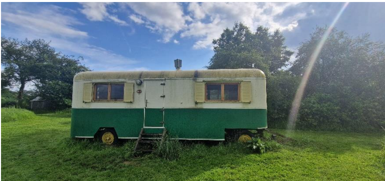
Notre roulotte pour la nuit ! Nogent-Le-Rotrou, 22 Mai 2024