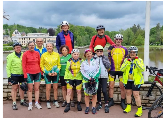
Les 3 groupes sont formés pour le grand départ. 20 Mai 2024