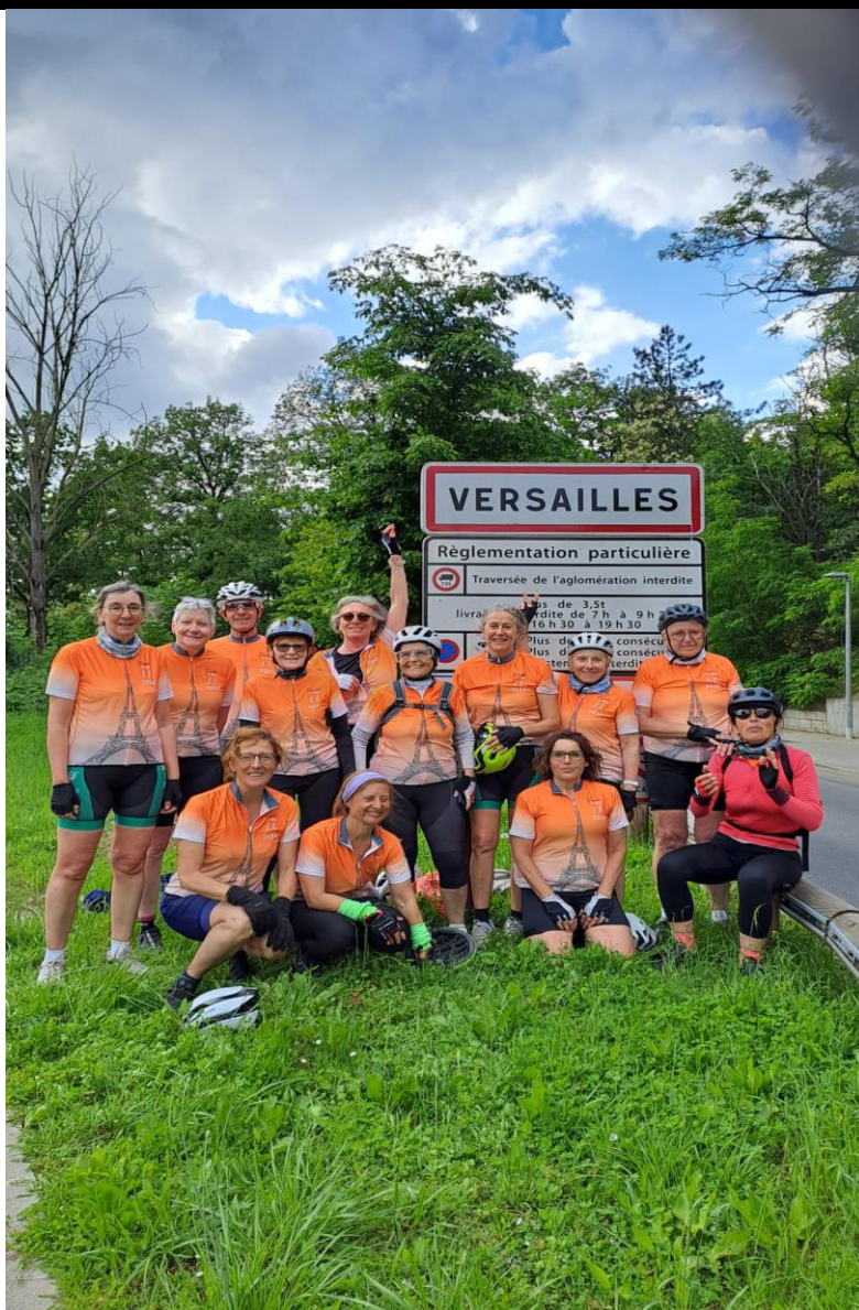
Le Groupe 2 devant le panneau Versailles, 24 Mai 2023